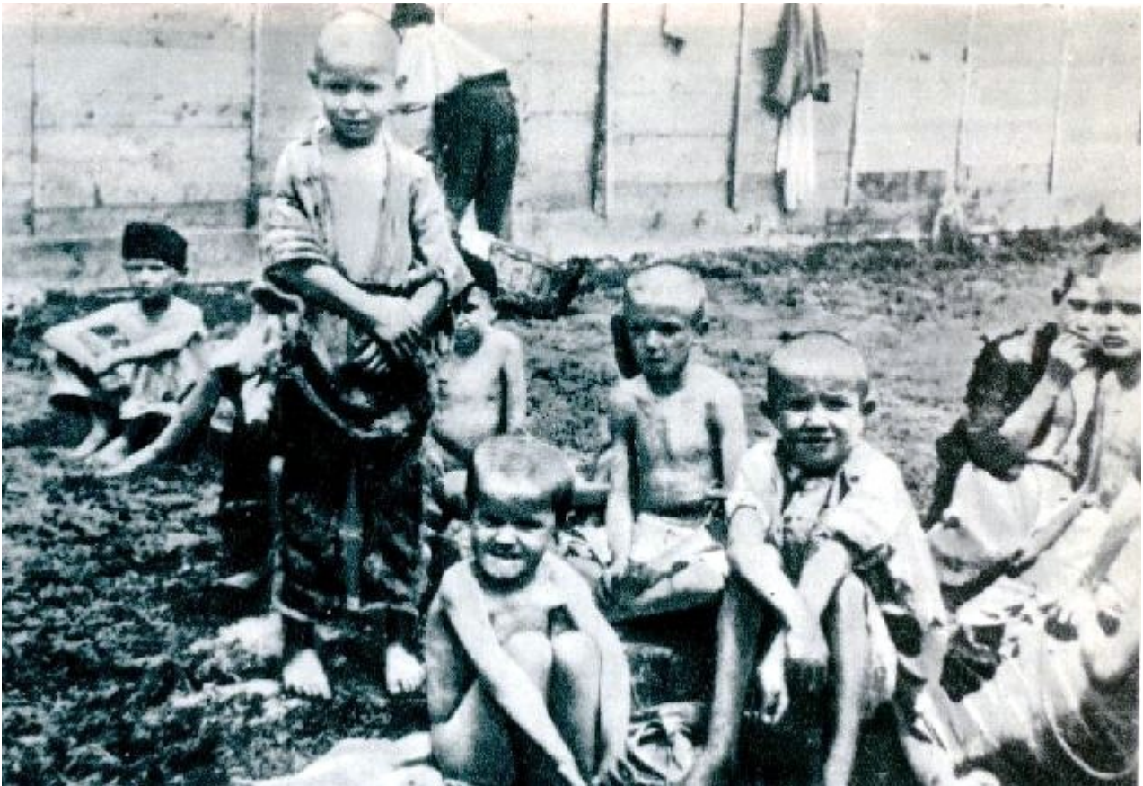
Bambini nel Campo di concentramento di Arbe - 1942

coatto o utilizzati come campi di smistamento. In tali lager vennero rinchiusi appartenenti alle popolazioni slave. Molti degli internati, fra cui anche vecchi, donne e bambini, trovarono la morte per inedia, malattie, torture o soppressione fisica.