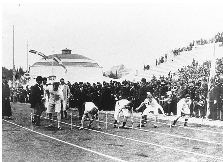
Partenza della II batteria dei 100 m

Il barone Pierre de Coubertin, ispirato dai Giochi antichi e desideroso di promuovere l'educazione fisica e l'unità tra le nazioni, propose la rinascita dei Giochi. Il 23 giugno 1894 fu fondato il Comitato Olimpico Internazionale (CIO) e i primi Giochi dell'era moderna furono tenuti ad Atene dal 6 al 15 aprile 1896 , con la partecipazione di 14 nazioni e circa 241 atleti.