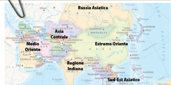
Cartina delle 6 regioni asiatiche

L'Asia centrale è nata in seguito allo scioglimento dell'URSS (Unione delle Repubbliche Socialiste Sovietiche), creata nel 1922, dopo la fine del regime Zarista che comprendeva i territori dell'impero russo.