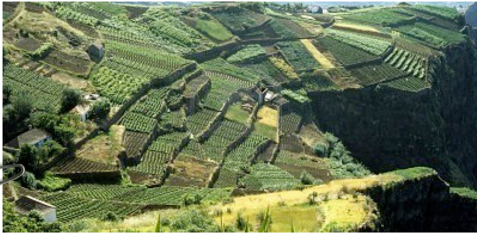
Coltivazioni in Asia