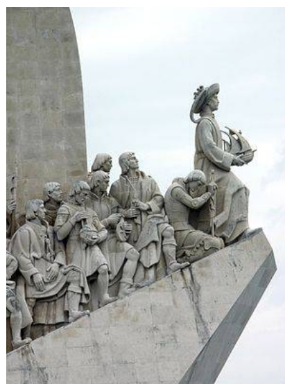
Enrico di Aviz, detto il navigatore

Tra la fine del medioevo e l'inizio dell'età moderna i portoghesi, e in particolare Bartolomeo Diaz e Vasco Da Gama, iniziarono a esplorare l'Africa, trovarono il modo di circumnavigarla per raggiungere l'India e migliorarono le conoscenze sull'Africa, per lo meno per ciò che concerneva le coste.