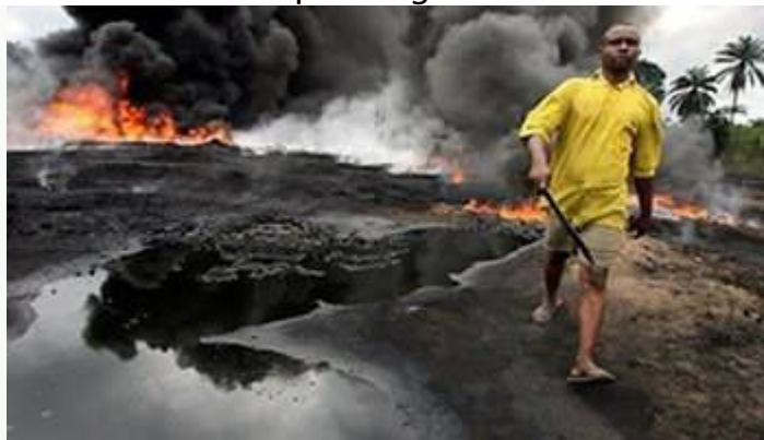
Il delta del Niger

Altro momento drammatico e cruciale della storia dell’Africa è il periodo del colonialismo imperialista. Nella corsa ad impossessarsi di terre da sfruttare per ricavarne materie prime per le proprie industrie, l’Europa si dedicò soprattutto all’Africa. Solo nella seconda metà del Novecento gli stati Africani riuscirono a riconquistare la loro indipendenza ma permangono problemi legati al retaggio coloniale (instabilità economica e politica) e tuttora l’influenza economica dell’Europa e degli USA è molto forte.